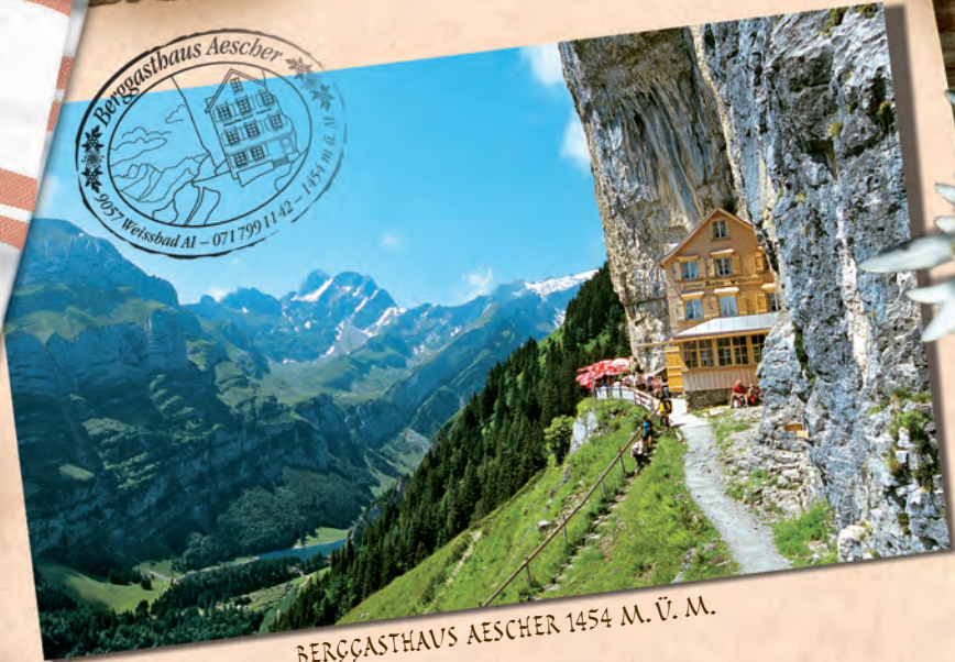
BERGGASTHAUS AESCHER 1454 M. Ü. M.

Herzlich Willkommen bi ös em Aescher obe!